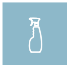
RENGJØRINGSMIDDEL MED LAV PH-VERDI (<7,5)