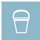
LUNKENT VANN (MAKS. 35°C)