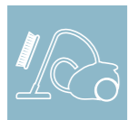
BRUSH/ VACUUM CLEANER